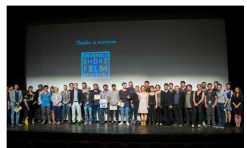
Cérémonie de clôture, BSFF 2016