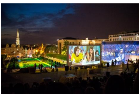
Projection en plein air, Mont des Arts

Le BSFF a 20 ans, et c'est donc à ne manquer sous aucun prétexte .